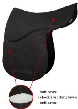
Dressur Contour Satteldecke

Wegen der hohen Prävalenz von Rückenschmerzen bei Pferden hat Sedelagic einzigartige Sattel Pads entwickelt. Die Sedelagic Pads sind verfügbar in zwei Dicken: 1 Schicht und 2 Schicht Pads. Erhältlich in den Größen S (Pony) bis L. Die Pads sind sehr atmungsaktiv und haben eine ausgezeichnete Druckverteilung und Stoßdämpfung. Nachfolgend finden Sie einige Pads und Satteldecken: