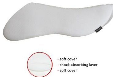
1 Schicht pad – schwarz / Weiß